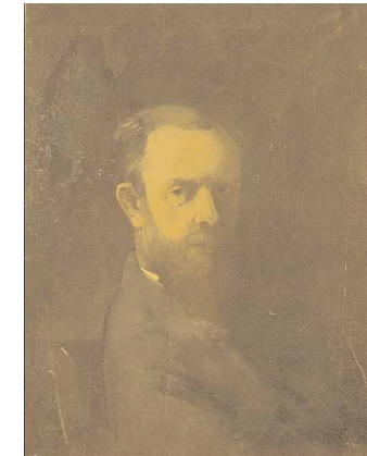
Autoportrait, huile sur toile, fin XIXème.