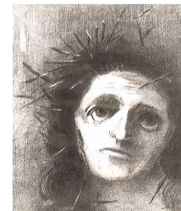
Tête de Christ, lithographie, 1887.