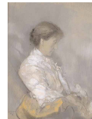
Portrait de Madame Redon, pastel, 1911.