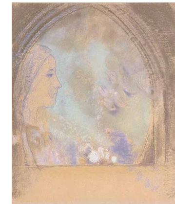
Profil de femme, pastel, fin XIXème.