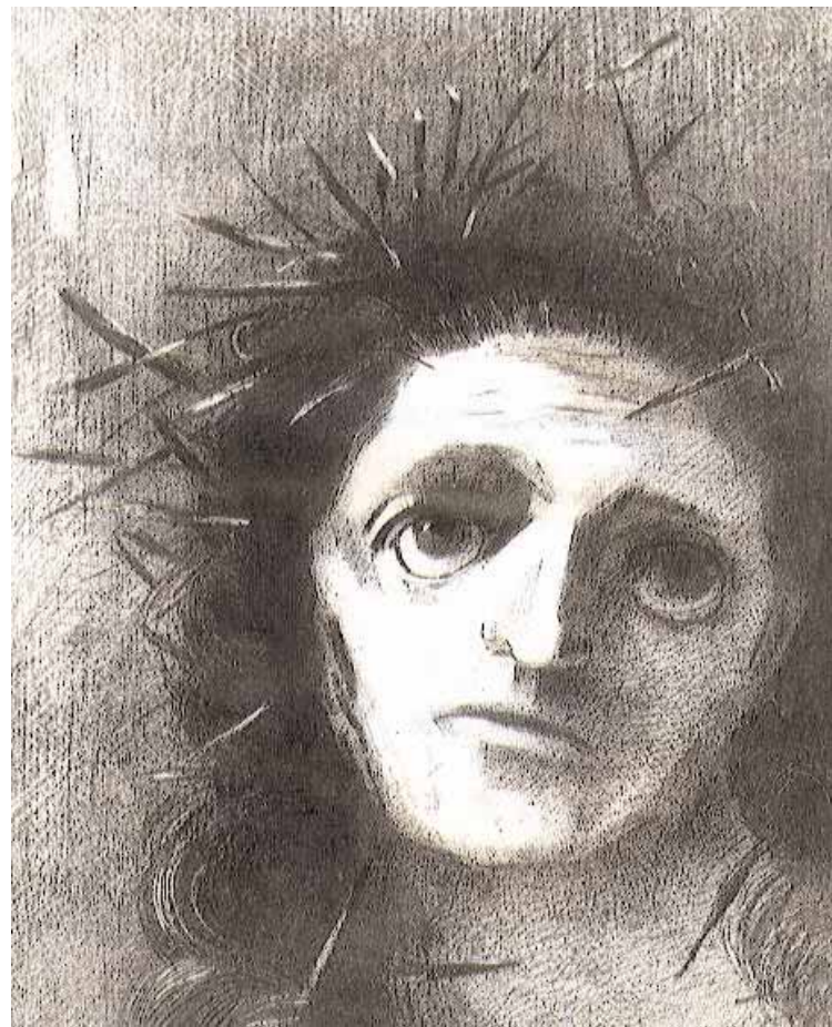
Tête de Christ, lithographie, 1887.