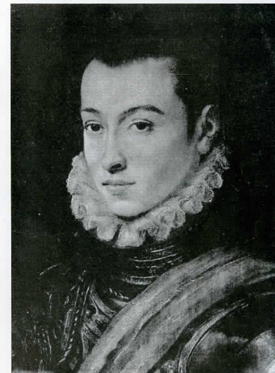
ECOLE PORTUGAISE. PORTRAIT DE JEUNE CHEVALIER