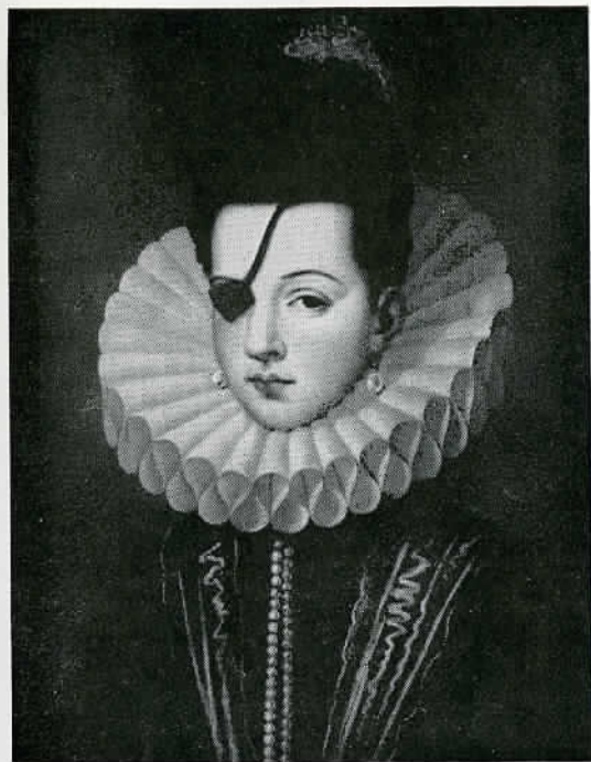
A. SANCHEZ COELLO. LA PRINCESSE D'EBOLI