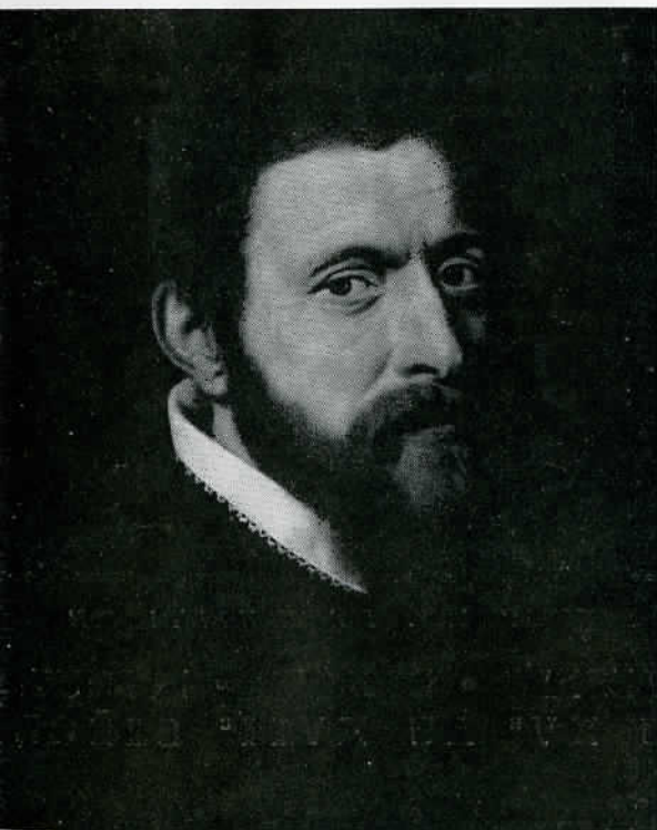
ANTONIO MORO. PORTRAIT DE JACOB DE MOOR

D EPUIS trois ans la Ville de Bordeaux, dans le cadre de son Festival annuel, organise une exposition internationale qui connaît, chaque année, un succès grandissant.