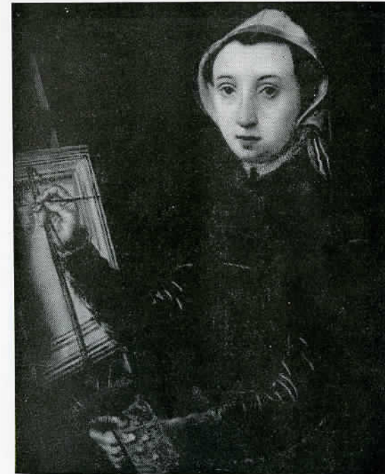
C. VAN HEMESSEN. AUTO-PORTRAIT

JACQUES CHABAN-DELMAS Député-Maire de Bordeaux