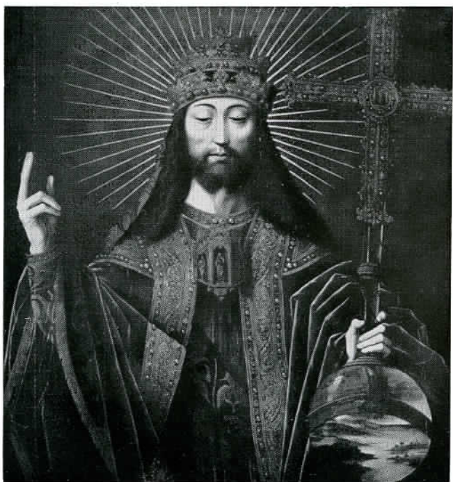
A. BENSON. LE CHRIST-ROI