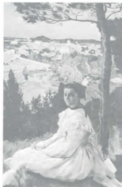
VUE DE VILLAGE F. BAZILLE (Musée de Montpellier)

Visites : tous les jours de 10 h à 19 h (sauf le mardi) Nocturnes : les mercredis et vendredis de 21 h à 23 h Audiovisuel - Visite commentée sur demande