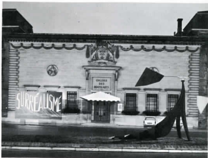
GALERIE DES BEAUX-ARTS - EXPOSITION 1971