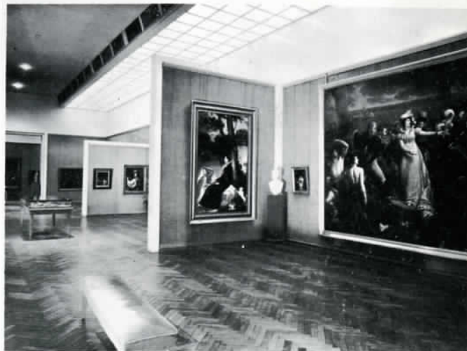
MUSÉE DES BEAUX-ARTS - SALLE DES XVII e ET XIX e SIECLES