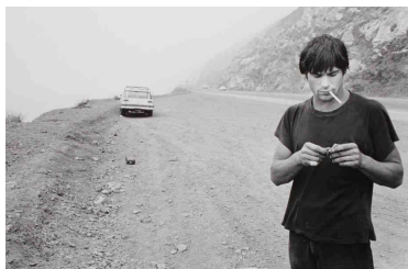
Photographies XIX e – XXI e siècles. Du Los Angeles County Museum of Art

28 août-10 novembre 2014-Galerie des Beaux-Arts