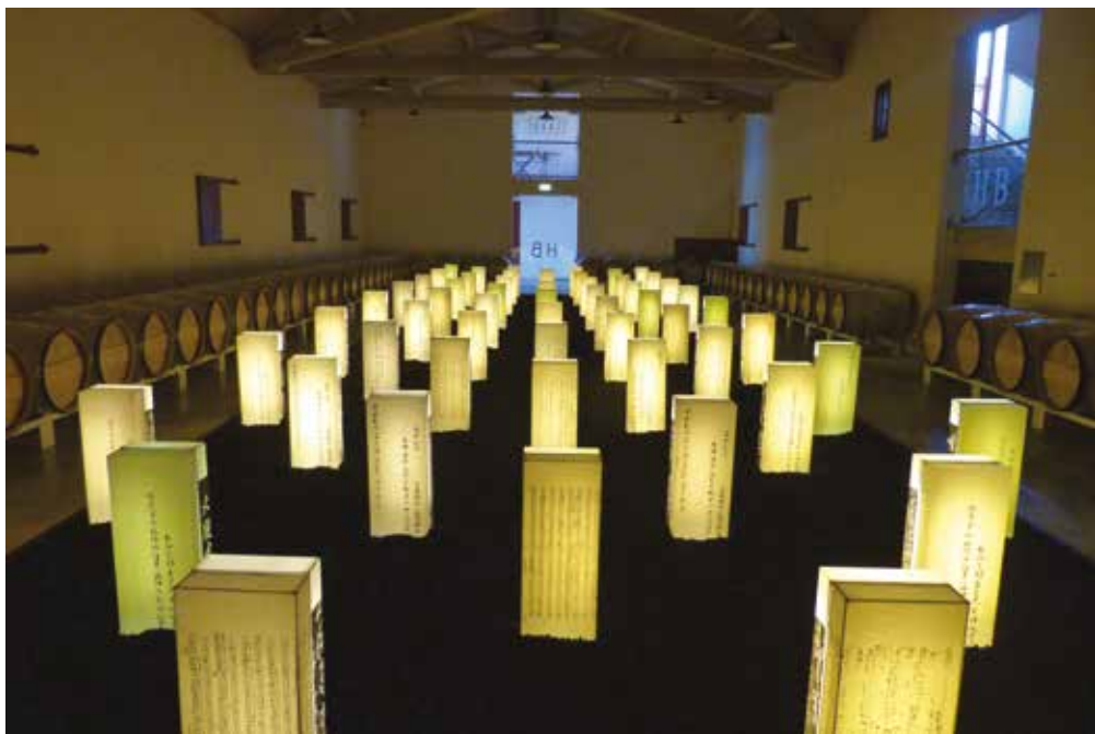
Vue de l'exposition Stèles , installation de Li Chevalier au château Haut-Bailly, 2014.