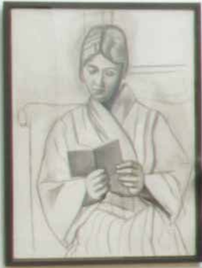
Vue de l'aile nord, visiteurs devant Olga lisant de Pablo Picasso, 1920, huile sur toile © Bordeaux, musée des Beaux-Arts.