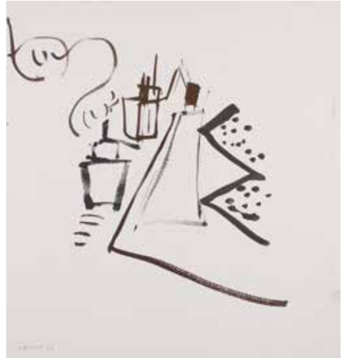
Daniel Dezeuze, Sans titre , 1963, gouache sur papier © CAPC musée d'art contemporain.