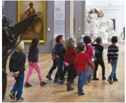
Enfants en visite dans le musée, aile nord.

Tarif : 5 € par enfant. Sur réservation. Voir agenda.