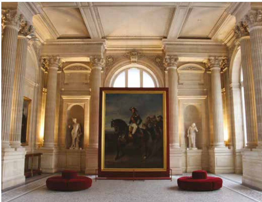
Vestibule d'honneur du musée, aile nord.