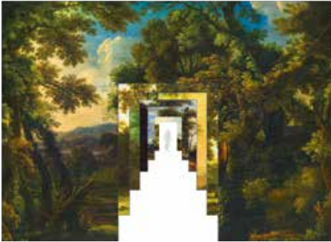
Franck Tallon, Détails , 2017, impression sur bâches. © Collection de l'artiste

L'installation réalisée au musée propose de traiter l'entrée de façon théâtrale, comme une interface, une transition entre l'espace public (la rue, le jardin) et l'espace intérieur du musée (les collections). Placée le long de la grille du jardin, l'installation est un regard porté sur la notion de paysages peints déclinés en quatre séquences de six panneaux imaginées à partir des collections du musée. C'est aussi bien sûr une invitation à découvrir les tableaux qui la composent, comme un prélude ou un épilogue à la visite.