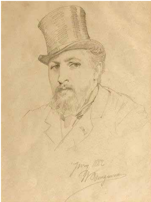
William Bouguereau, Autoportrait en chapeau haut-de-forme , Ivry 1882, crayon noir © Bordeaux, musée des Beaux-Arts.

Deux autoportraits nouvellement acquis en vente publique à Bordeaux viennent d'entrer dans les collections du cabinet d'arts graphiques. Le premier représente William Bouguereau (La Rochelle, 1825-1905) dont le musée conserve des œuvres importantes telles que La Bacchante ou Le Jour des morts , sous un visage un brin narquois. Son chapeau haut-de-forme donne un air de dandy, à l'encontre de l'image plus connue du grand académicien solennel.