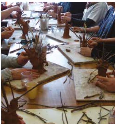
Atelier Arbre à idées réalisé hors les murs à l'hôpital de Lormont, dans le cadre de l'exposition La nature silencieuse. Paysages d'Odilon Redon , 2017.

Voir page 7. Pour tout renseignement : servicedespublics-mba@mairie-bordeaux.fr Tél. : 05 56 10 25 25