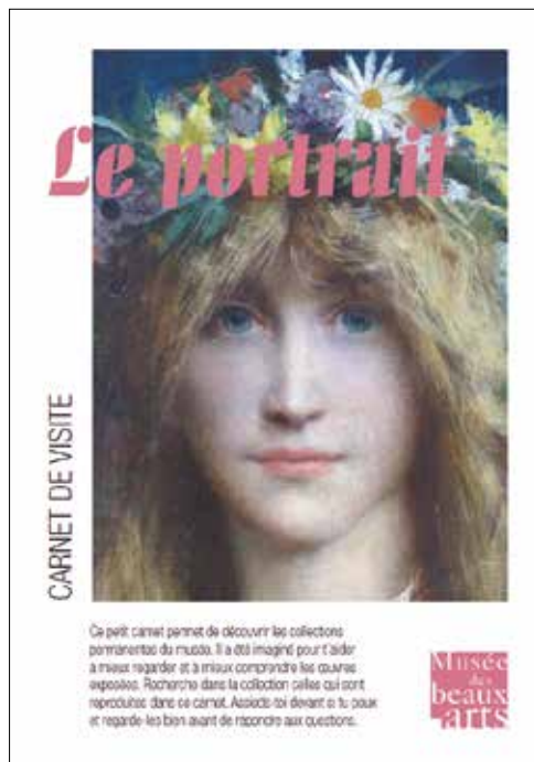
Carnet de visite Le portrait

Le musée propose des outils pédagogiques (mallettes « jeu de piste », carnets de visite) disponibles gratuitement à l'accueil du musée, permettant une découverte ludique des collections en famille.