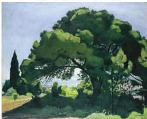
Albert Marquet, Pin à Alger , 1932, huile sur toile © Bordeaux, musée des Beaux-Arts. Photo L. Gauthier.

Le musée tient à remercier la Société des Amis du Musée des Beaux-Arts de Bordeaux pour son soutien dans le cadre des restaurations d'œuvres pour cette exposition.