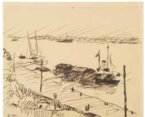
Albert Marquet, Quai de Galatz (Bessarabie) , 1933, plume et encre de Chine sur papier collé sur carton © Bordeaux, musée des Beaux-Arts.