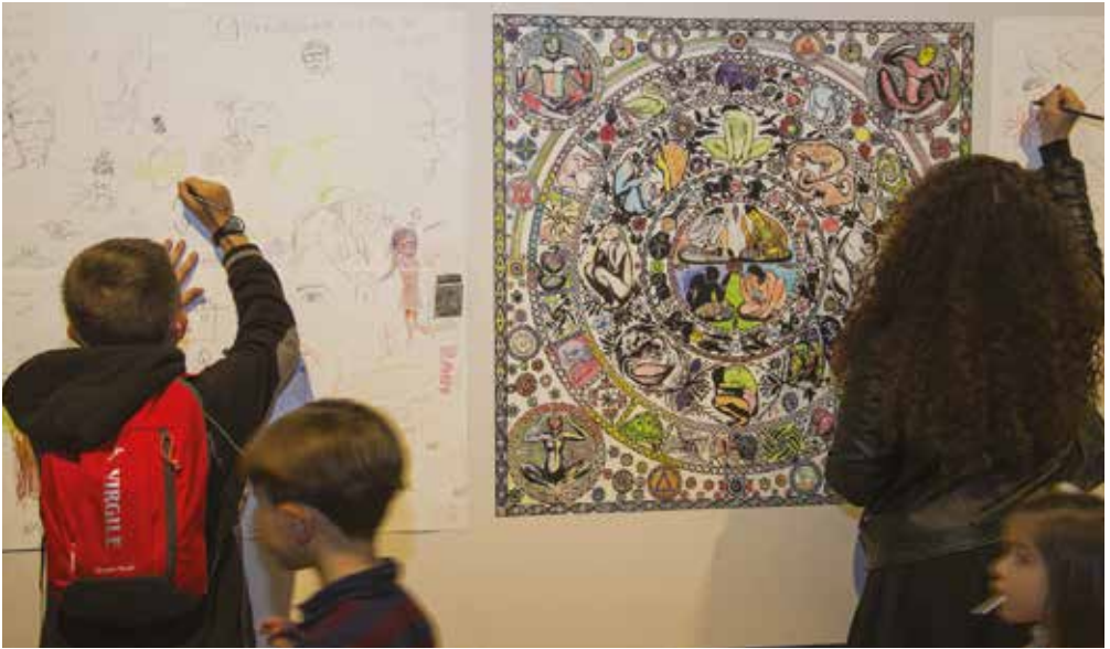
Atelier « Mandala », Nuit des musées 2017, photo Lysiane Gauthier.