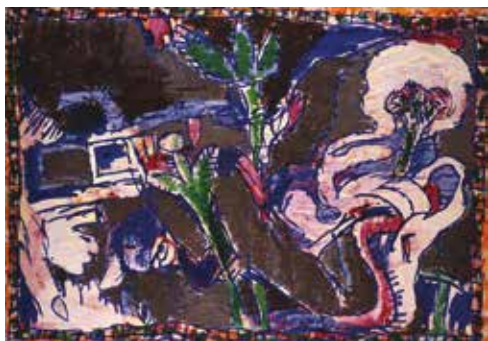
Pierre Alechinsky, Ceci peint comme on dit : dit , 1981, acrylique sur papier maroufflé sur toile