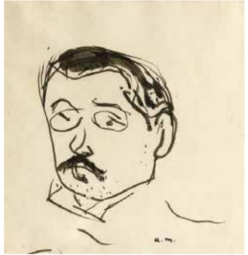
Albert Marquet, Autoportrait , non daté, plume et encre noire © Bordeaux, musée des Beaux-Arts.

Le second, de la main d'Albert Marquet (Bordeaux, 1875 – Paris, 1947), représente un clin d'œil, au sens propre comme au figuré, à l'autoportrait peint de l'artiste, conservé dans les collections du musée. Ce dessin à l'encre de Chine, typique de la technique du célèbre Bordelais, est révélateur de l'humour de l'artiste et de la spontanéité de son trait.