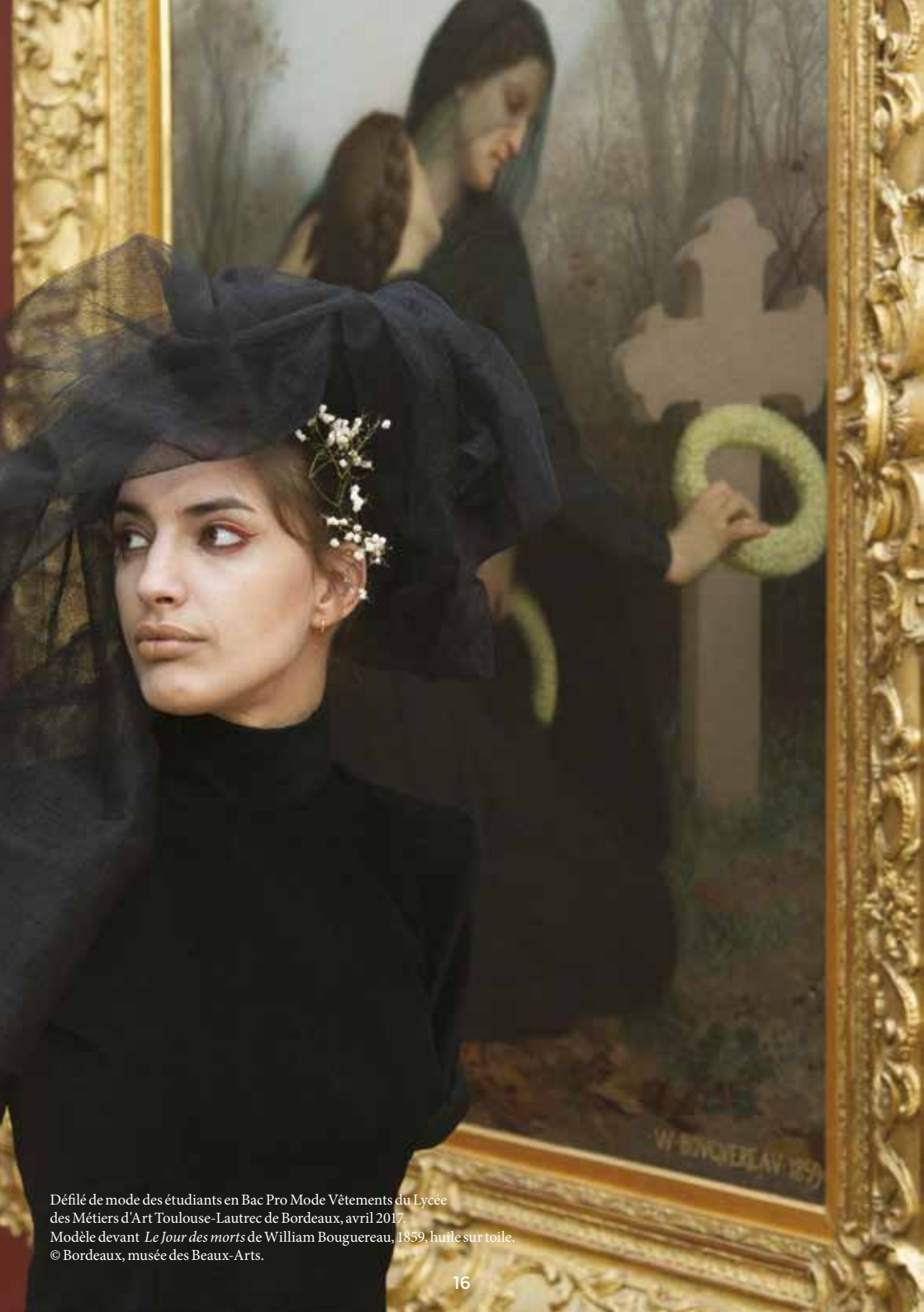
Défilé de mode des étudiants en Bac Pro Mode Vêtements du Lycée des Métiers d'Art Toulouse-Lautrec de Bordeaux, avril 2017. Modèle devant Le Jour des morts de William Bouguereau, 1859, huile sur toile. © Bordeaux, musée des Beaux-Arts.