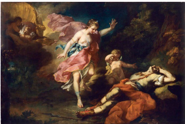
Jean Faur Courrège, Vénus pleurant la mort d'Adonis , 1753.