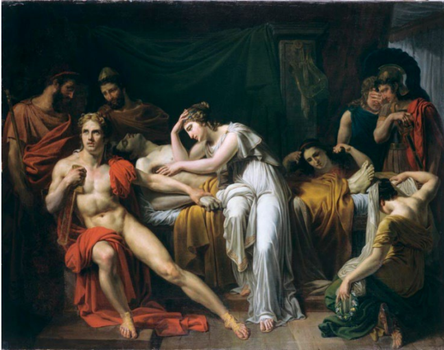
Jean Michel Gué, La mort de Patrocle , XIX e siècle.