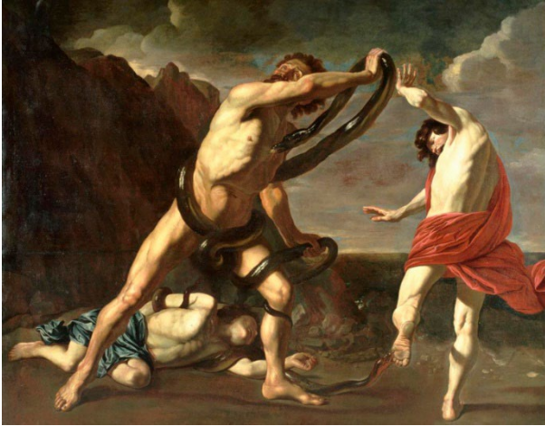
Pieter Claez Soutman, Laocoon et ses fils mordus par les serpents , XVII e siècle.

Les personnages de cette scène sont attaqués par plusieurs serpents, quels sont les éléments utilisés par l'artiste pour intensifier la tension dramatique de la scène ?