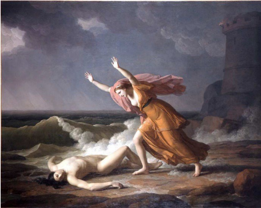
Héro et Léandre , Jean-Joseph Taillasson, 1798.

Regarde l'attitude des personnages du tableau. Selon toi, que s'est-il passé ?