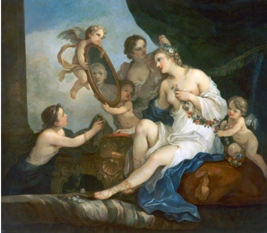
Charles Joseph Natoire, Vénus à sa toilette , 1742.

Après Titien, de nombreux artistes se sont attachés à illustrer des épisodes issus de la légende de Vénus (et ce jusqu'à l'abandon de la figuration au XX e siècle).