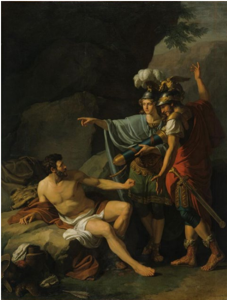
Jean Joseph Taillason, Ulysse et Néoptolème enlevant à Philoctète les flèches d'Hercule , 1784.