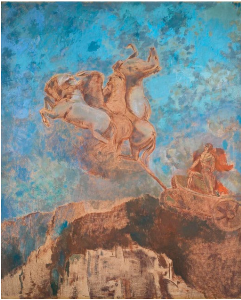
Odilon Redon, Le char d'Apollon , 1909.