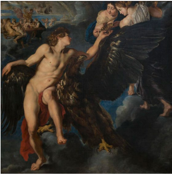
, Pierre Paul Rubens, L'enlèvement de Ganymède , XVIIe siècle.