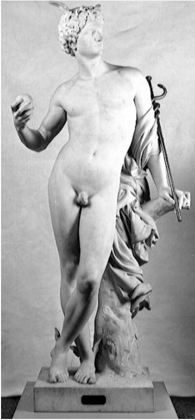
Maximilien Bourgeois, Mercure , 1877.