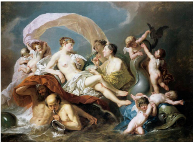
Johan Josephus Zoffany ou Zoffany, Vénus sur les eaux , vers 1760.