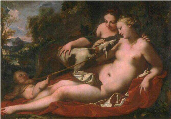
Antonio Bellucci, L'Amour jaloux de la Fidélité , XVIII e siècle.

Observe le tableau. En t'aidant du titre, peux-tu dire qui est l'Amour et qui est la Fidélité ? L'Amour est souvent représenté dans la peinture sous la forme d'un petit ange. La fidélité est quant à elle symbolisée par la représentation d'un chien tenu ici en laisse.