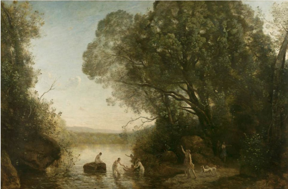
Jean-Baptiste Camille Corot, Le bain de Diane , 1855.