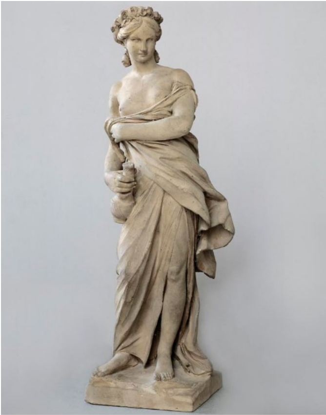
Pierre-François Berruer, Hébé , 1767.