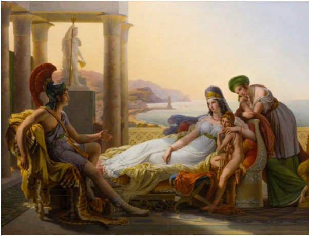
Pierre-Narcisse Guérin, Énée racontant à Didon les malheurs de Troie , 1817.