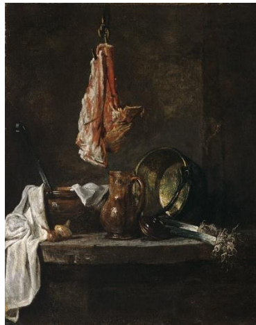
Jean-Baptiste Siméon Chardin, Nature morte aux morceaux de viande , 1730, Huile sur toile

Au XVIII e siècle, la représentation d'objets occidentaux passe du symbolisme à l'esthétisme et vice versa. La nature morte se place ainsi dans le désir artistique de rivaliser avec la Nature, hérité de l'Antiquité et redécouvert à la Renaissance.