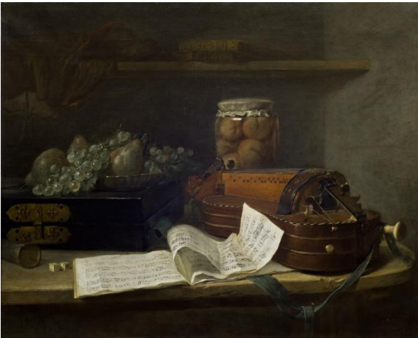
Henri Horace Roland de la Porte, Nature morte à la vielle , 1760 (vers), Huile sur toile

Dans la peinture de Roland Horace de la Porte, les divers éléments réunis évoquent les plaisirs de la vie et les cinq sens : le goût du jeu ou le toucher est symbolisé par le cornet et les dés, les délices de la table ou la vue, le goût et l'odorat sont concrétisés par le bocal de pêches, les raisins et les poires dans le compotier, l'harmonie des sons ou l'ouïe sont illustrées par une magnifique vielle à roue. Jadis instrument des aveugles et des chanteurs ambulants, la vielle à roue participe à cet engouement pour la vie simple qui saisit la haute société de l'Ancien Régime.