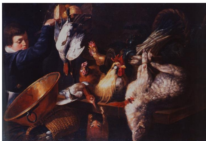
Giacomo Legi, Jeune homme dans un garde-manger , XVII e siècle, Huile sur toile