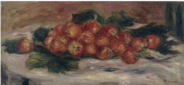
Pierre Auguste Renoir, Les Fraises , XIX e , Huile sur toile Attention ! c'est un petit format (40x62 cm avec cadre)

Peintre apparenté aux Impressionnistes, Auguste Renoir évolue vers un style plus réaliste. Il peint près de quatre mille tableaux dont de nombreuses natures mortes. Il aurait, sur son lit de mort, demandé une toile et des pinceaux pour peindre le bouquet de fleurs qui se trouvait sur le rebord de sa fenêtre.