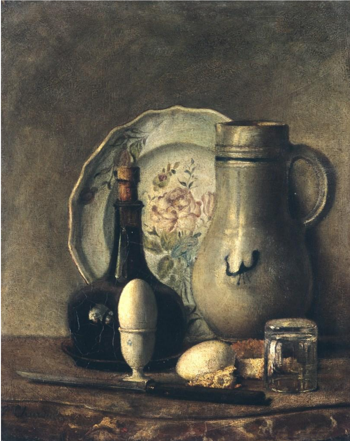
Anonyme français XIX e , Nature morte , Huile sur toile

Dossier pédagogique pour les enseignants du premier degré