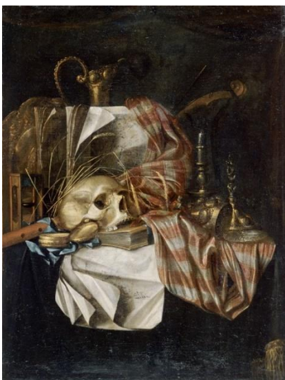
Cornelis Norbertus Gysbrechts, Vanitas , XVII e , Huile sur toile