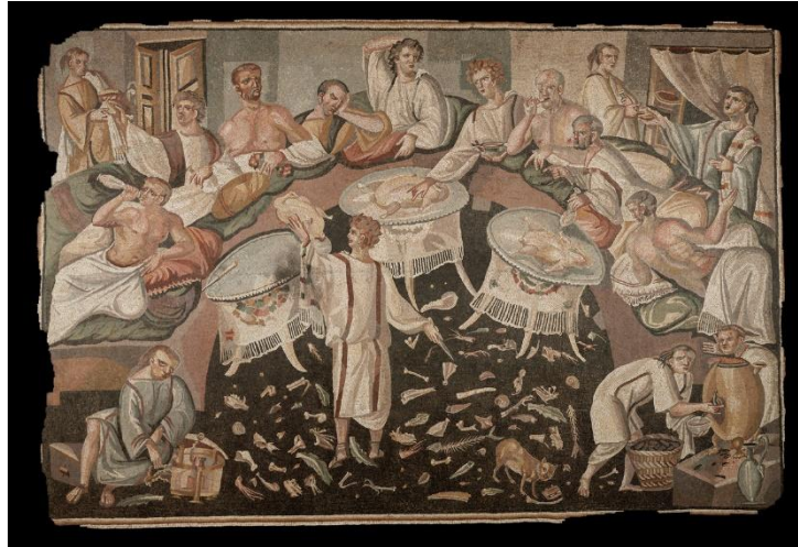
Mosaïque d'un symposium figurant un asarotos oikos (au sol non balayé) Art romain, Est de la Méditerranée, Levant, Collection privée

Les premières natures mortes datent de l'époque hellénistique, mais il ne nous en reste que des descriptions, aucune peinture de l'Antiquité n'ayant survécu. Elles représentaient généralement des mets prêts à être consommés.