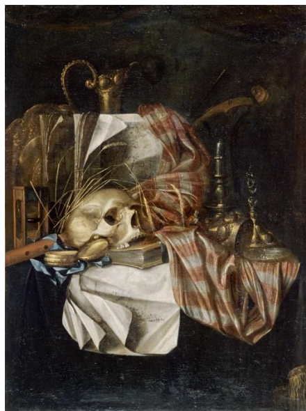
Cornelis Norbertus Gysbrechts, Vanitas , XVII e , Huile sur toile

De nombreux peintres en Hollande et en Flandre produiront beaucoup de vanités pour les riches et prospères marchands d'Anvers, d'Amsterdam, qui comptent à l'époque parmi les plus grands ports du monde.