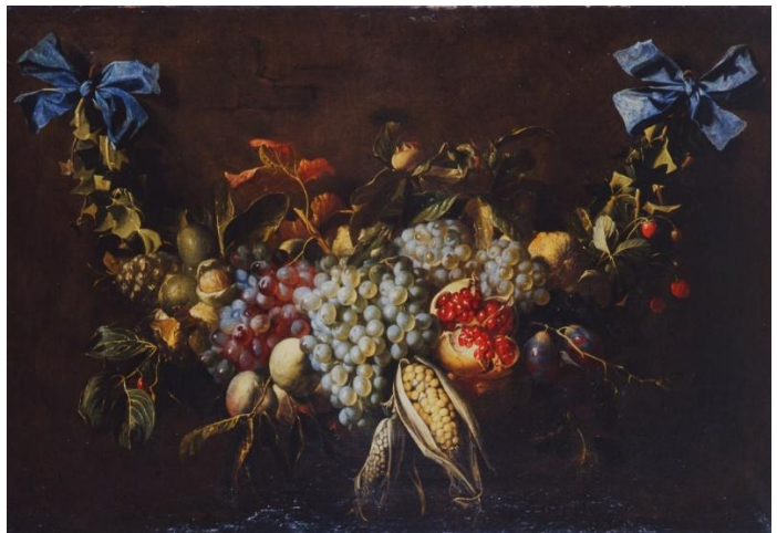
Alexander Coosemans, Guirlande de fruits , XVII e siècle, Huile sur toile