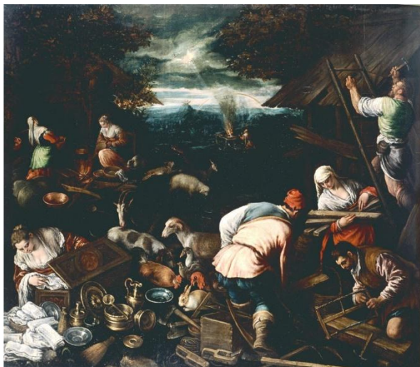
Atelier de Leandro Bassano (dit) Da Ponte et Jacopo Bassano (dit) Da Pointe Bassano (dit), Le Sacrifice de Noé après la sortie de l'arche , XVI e , Huile sur bois