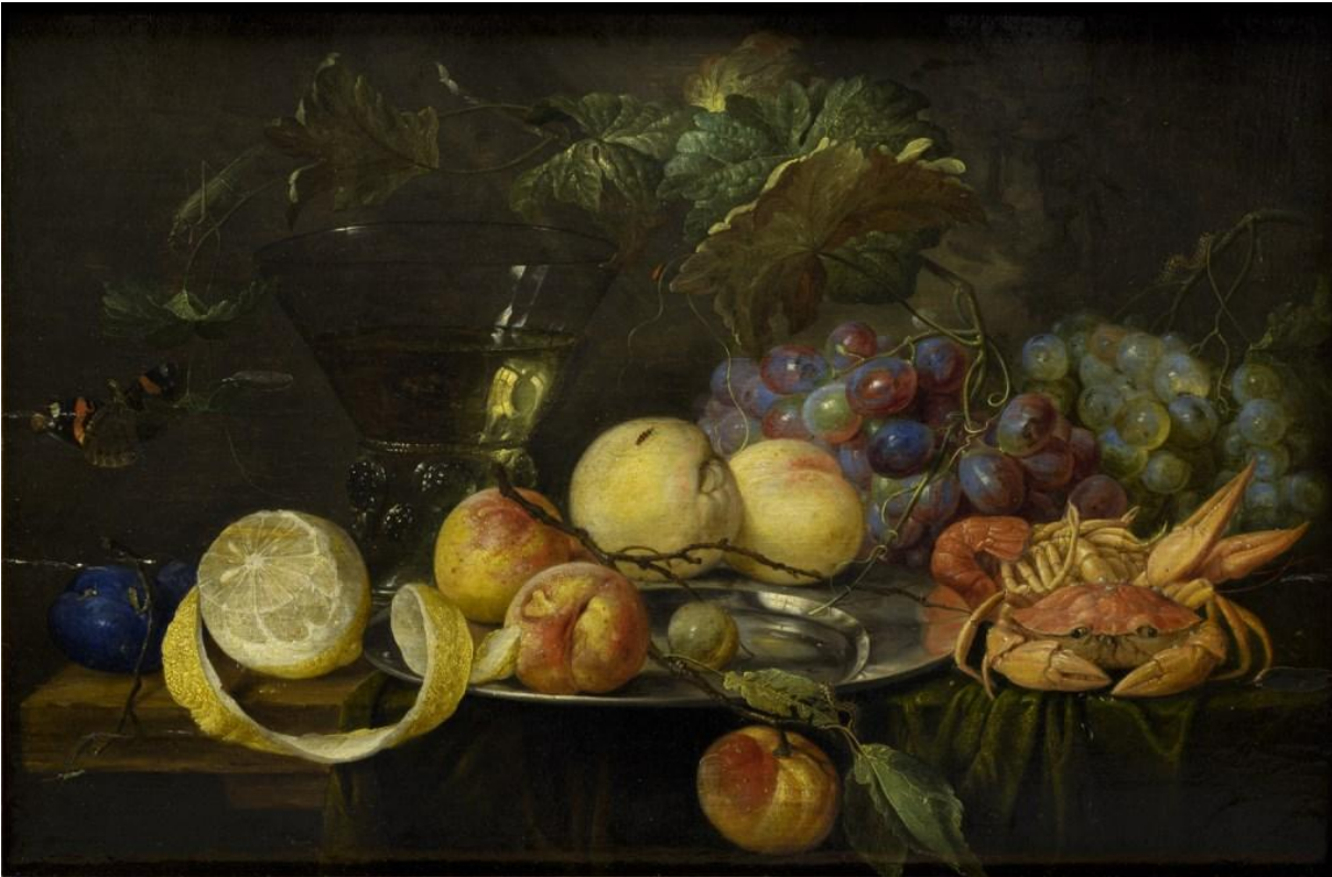
Jan Van Kessel, Nature morte aux fruits et crustacés , 1653, Huile sur bois

L'existence de Jan Van Kessel (1626-1679) semble s'être déroulée entièrement dans sa ville natale. À peine âgé de huit ans, il commence son apprentissage chez Simon de Vos et devient maître dans la Corporation des artistes d'Anvers en 1645. Il se spécialise dans la peinture d'animaux, d'oiseaux, de poissons, et d'insectes dans la tradition de son oncle Jan Brueghel de Velours. On lui doit notamment les importantes séries des Animaux (Madrid, Musée du Prado), comportant quarante panneaux, et celle des Quatre parties du monde (Munich, Bayerische Staatsgemäldesammlung), comportant quarante-six panneaux ; on peut supposer que ces tableaux étaient destinés à orner des cabinets de marqueterie dont Anvers était alors un centre de fabrication. Il réalise également des " tables servies " pour lesquelles il choisit des supports de cuivre et c'est un délicat peintre de fleurs. Les œuvres de Jan Van Kessel étaient appréciées par ses contemporains car nombre d'entre elles figuraient dans les anciens cabinets d'amateurs à Anvers, et de son vivant déjà, des copies circulaient sur le marché de l'art et se vendaient à bas prix.