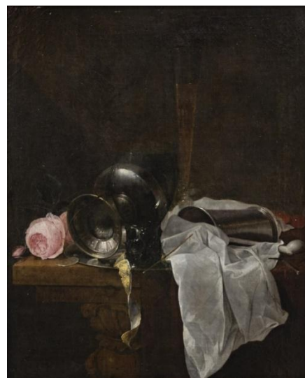
Jan Davidsz De Heem, Roses, coupe et timbale avec deux verres sur une table , 1636, Huile sur toile