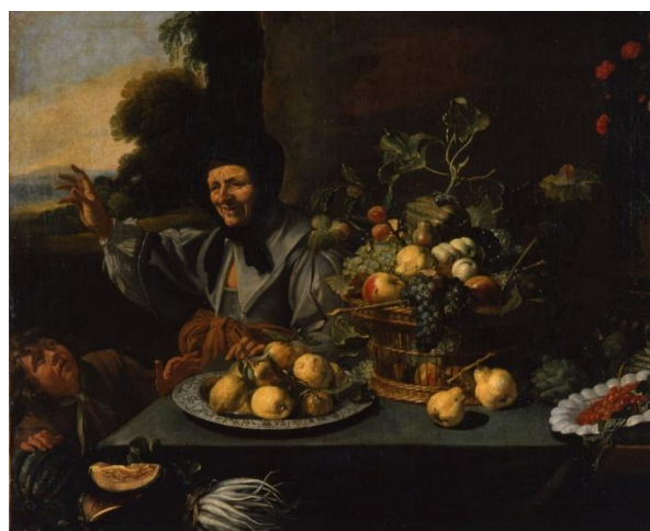
Pierre Van Boucle, Une vieille femme défendant son étal de fruits à un jeune chapardeur , XVII e , Huile sur toile