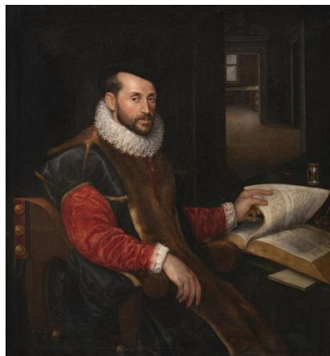
Lavinia Fontana (épouse Zappi), 1577, 1578, Portrait d'homme assis feuilletant un livre (dit du sénateur Orsini) , Huile sur toile