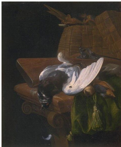
Melchior d'Hondecoeter, Trophée de chasse , XVII e , Huile sur toile