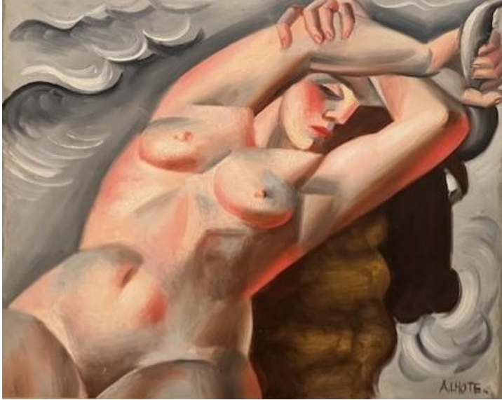
André Lhote, l'enlèvement d'Europe , 1925-1930, huile sur toile