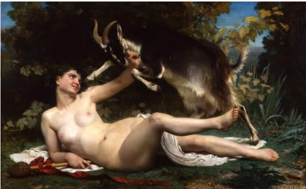
William Bouguereau (1825-1905), Une Bacchante , 1862, huile sur toile

William Bouguereau (1825-1905) est un peintre français représentatif de la peinture académique. Déconsidéré en Europe peu après sa mort et jusque vers la fin du 20 e siècle, son œuvre est redécouverte tardivement.