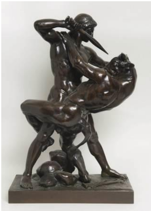
Antoine Louis Barye (1795-1875), Thésée combattant le Minotaure , 1843, Bronze

Le sculpteur évoque ici un thème mythologique. Les deux corps qui révèlent une musculature parfaite semblent livrer une lutte acharnée. Le glaive brandi par Thésée laisse deviner que l'issue du combat sera fatale au monstre.