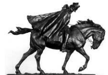
Jean-Louis Ernest Meissonnier (1815-1891), Le Voyageur , 1909 (après), bronze fondu d'un seul jet avec patine par oxydation

Jean-Louis Ernest Meissonnier (1815-1891) est un peintre spécialisé dans les scènes de batailles ou militaires. Il exécute des sculptures qui l'aident dans la réalisation de ses peintures. En 1859, l'artiste suit l'armée de Napoléon III comme attaché à l'état major et ambitionne de peindre l'épopée napoléonienne en cinq grandes toiles. Très soucieux du détail, il multiplie les études sous forme de maquettes en cire avec fils de fer et tissus. Il prend appui sur des petites mises en scène pour mettre en place ses compositions. Ses tableaux historiques célèbres sont : La retraite de Russie , Les cuirassiers et Waterloo , l'Apothéose impériale .