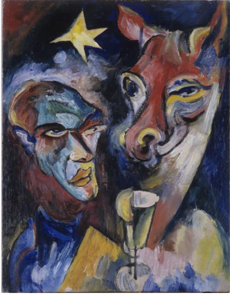
Raoul Hausmann, Psychogramme , 1917, huile sur toile

Cette peinture expressionniste de Raoul Hausmann met en scène un personnage dont le visage est allongé et inquiétant et un cheval aux formes elles-aussi exagérées. Les couleurs sont très vives, l'étoile jaune en haut pourrait évoquer l'univers du cirque mais l'artiste cherche surtout à provoquer chez son spectateur une émotion forte.