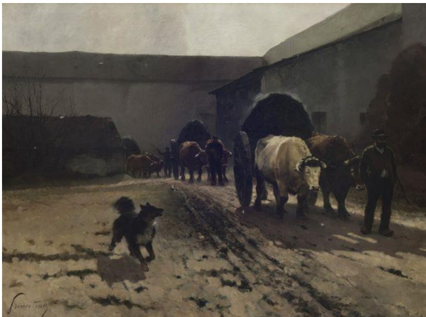
René Princeteau, Équipages de boeufs charriant des engrais , 19 e siècle, huile sur toile