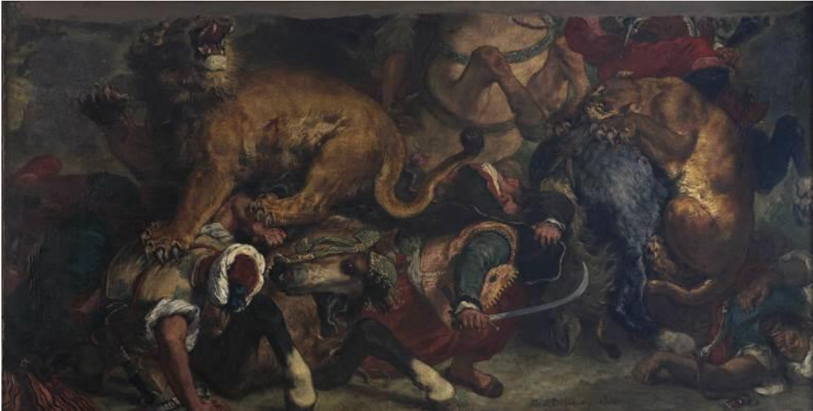
Eugène Delacroix (1798-1863), La Chasse aux lions , 1855, huile sur toile

La plupart des peintures orientalistes dépeignent un Orient entre réalité et imaginaire. Tous les artistes ayant, à cette époque, représenté l'Orient n'ont pas obligatoirement voyagé dans les pays du Moyen-Orient. Cependant, la majorité des peintres dits orientalistes tels qu'Eugène Delacroix et d'autres ont entrepris de longs voyages dans les pays orientaux (Afrique du Nord, Proche et Moyen-Orient) pour en rapporter de nombreux carnets de croquis. Ils s'en servent pour la composition de leurs peintures une fois revenus au pays. Les dessins nourrissent leur inspiration pendant des années.