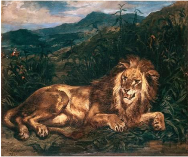
Eugène Delacroix (1798-1863), Un lion à la source , 1841, huile sur toile

Couché parmi des roseaux, le lion semble rugir à l'approche de cavaliers qu'on aperçoit dans le fond gravissant au galop les pentes de la montagne où il a établi son repaire. En 1840, Delacroix s'essaye à un genre nouveau, sorte de transposition picturale des œuvres animalières sculptées par Barye, enrichie par son imagination et ses