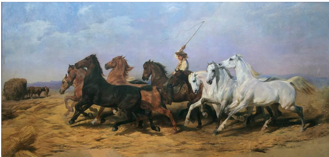
Rosa Bonheur (1822-1899), La foulaison du blé en Camargue , 1864-1899, huile sur toile

Le sujet du tableau est inspiré par une légende racontée par Frédéric Mistral dans son roman « Mireille ». Le dépiquage de blé par la foulaison est un procédé traditionnel employé en Camargue encore au début du XX e siècle. Des chevaux camarguais à demi sauvages (de type morphologique arabe), conduits par un