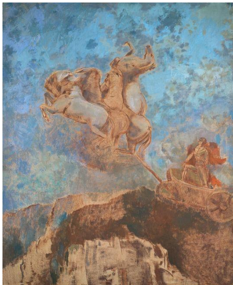
Odilon Redon, Le Char d'Apollon , 1909, huile et pastel sur carton

Le char d'or s'élance dans l'azur du ciel mené par Apollon, dieu de la lumière. Quatre chevaux fougueux emportent vers le ciel où les couleurs du jour commencent à apparaître, le char d'Apollon. Le dieu solaire, représenté de trois-quarts, se tient debout dans son quadrigue, fier et conquérant, partant d'un sommet de montagne rocheuse comme d'une rampe de lancement, tandis que son attelage est déjà lancé dans les airs. Le cheval de droite, se dresse et se cabre, tente un élan vers le ciel. Les Chars d'Apollon de Redon évoquent le combat de la lumière contre l'obscurité.