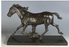
Jean-Louis Ernest Meissonnier (1815-1891), Cheval au trot , 1860 (après), bronze à patine brune