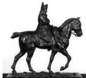
Jean-Louis Ernest Meissonnier (1815-1891), Napoléon 1er en 1814 , après 1860 (après), bronze patiné par oxydation