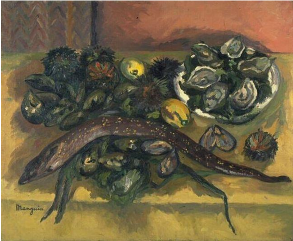
Henri-Charles Manguin, Nature morte aux oursins et à l'anguille , 1925, huile sur toile

De nombreux peintres du 20 e siècle, ont repris le thème de la nature morte dans lesquelles des animaux morts sont souvent représentés.