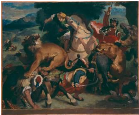
Odilon Redon (1840-1916), Copie d'après La Chasse aux lions de Delacroix, 1867, huile sur toile

Ce tableau fut endommagé dans sa partie supérieure par le terrible incendie du musée de 1870. Dans cette chasse aux lions , les fauves semblent prendre le dessus sur les chasseurs africains. Une copie exécutée par l'artiste bordelais Odilon Redon (1840-1916) peinte avant que l'original soit endommagé nous donne la solution : dans cette terrible chasse, l'homme va encore une fois triompher des fauves.