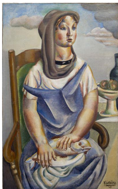
Roger Bissière, La Jeune Fille au poisson , 1920, huile sur toile