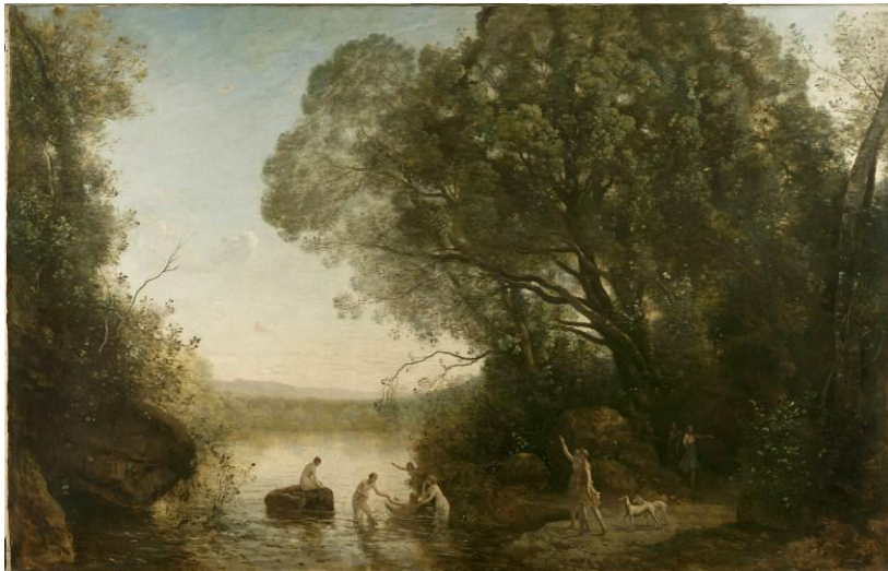
Camille Jean-Baptiste Corot (1796-1875), Le Bain de Diane , 1855, huile sur toile

Camille Jean-Baptiste Corot (1796-1875) passe longtemps pour un peintre amateur qui avait tout loisir de voyager non seulement un peu partout en France, mais aussi en Italie, où il réside à trois reprises. Au cours de ses