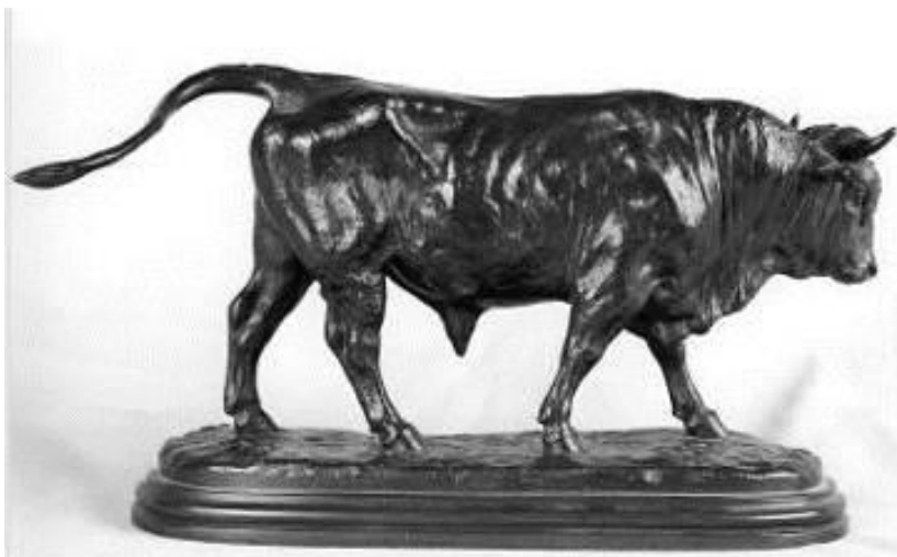
Rosa Bonheur (1822-1899), Un taureau marchant , 1846, bronze à patine brune