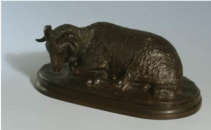
Rosa Bonheur (1822-1899), Un bélier couché , 1853 (avant), bronze, patine brune

Nous pouvons remarquer le travail très méticuleux de l'artiste et son observation très étudiée de l'animal.