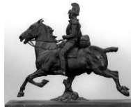
Jean-Louis Ernest Meissonnier (1815-1891), Le Cuirassier , après 1860 (après), bronze fondu d'un seul jet avec patine par oxydation