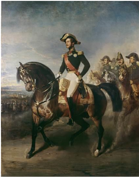
Alfred Dedreux (1810-1860), Portrait équestre du duc d'Orléans , 19 e siècle, huile sur toile

Pierre-Alfred Dedreux (1810-1860) signe ses toiles sous le nom d'Alfred De Dreux. Il est un portraitiste et peintre animalier français qui s'est spécialisé dans la représentation du cheval. Les rois de France ou les princes héritiers comme ici le duc d'Orléans (1810-1842), fils aîné de Louis-Philippe I er , roi des français, sont souvent représentés à cheval. Le portrait équestre donne de l'allure au sujet et met en avant sa fonction de lieutenant général de cavalerie.