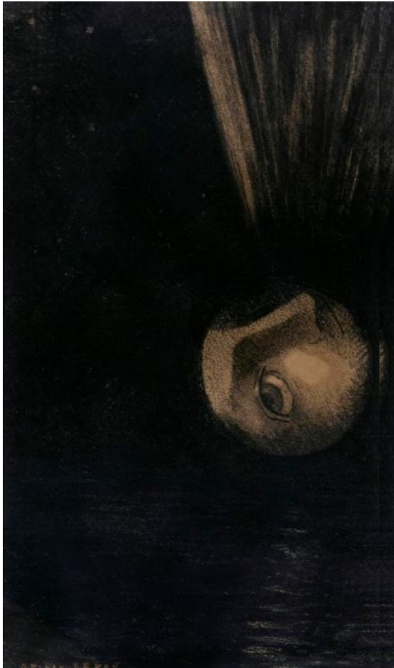
← Odilon Redon, Le Météore , 19 e siècle, legs Robert Coustet en 2020.