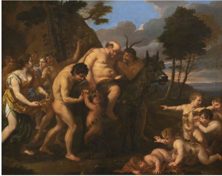
↑ Karel Philips Spierincks, Le Triomphe de Silène , vers 1630, don de la Société des Amis du musée des Beaux-Arts de Bordeaux en 2020.