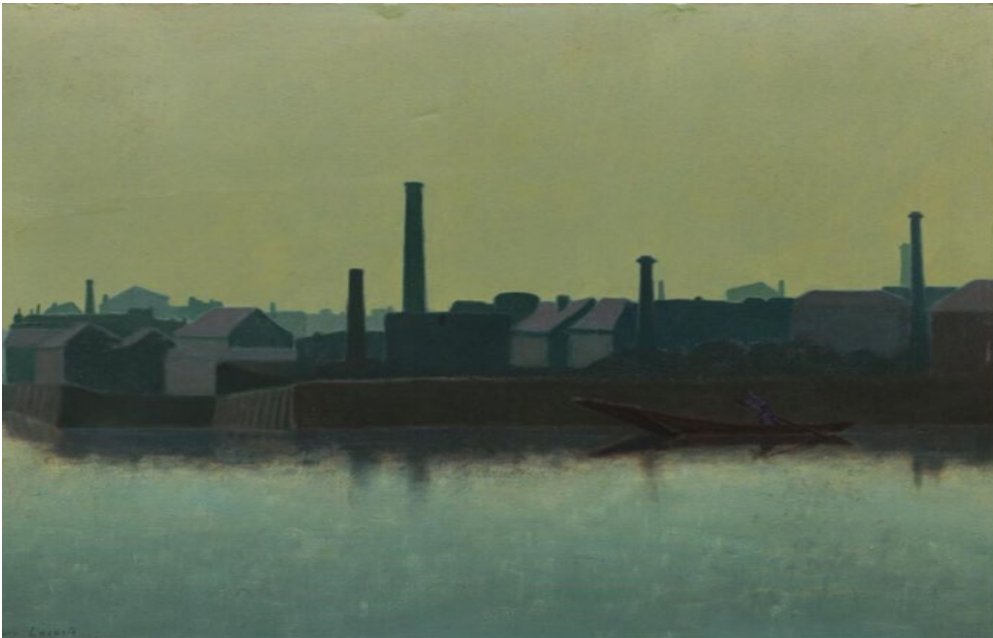
↑ Charles Lacoste, Londres, la Tamise à Battersea. Crépuscule , 1901, achat de la Ville de Bordeaux en 2025.