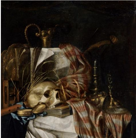
Cornelis Norbertus Gysbrechts, Vanité , 17 e siècle, huile sur toile