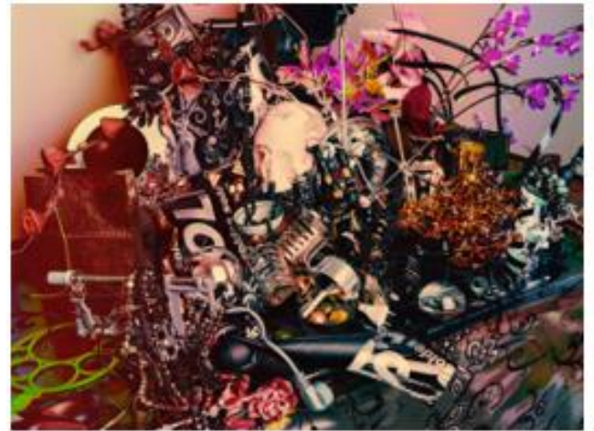
Valérie Belin, Still Life with Pearls (Still Life) , 2014, tirage pigmentaire, © ADAGP Paris 2024, Valérie Belin, Courteys de l'artiste et Galerie Nathalie Obadia, Paris/Bruxelles

Les vanités appartiennent au genre de la nature morte. Elles se développent aux Pays-Bas à partir du 17 ème siècle. Elles représentent la vie humaine au moyen de motifs symboliques destinés à mettre en évidence son inconsistance et sa fragilité.