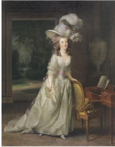
Johann Friedrich August Tischbein, Portrait de la princesse Frédérique Louise Wilhelmine d'Orange-Nassau, 1788, huile sur toile