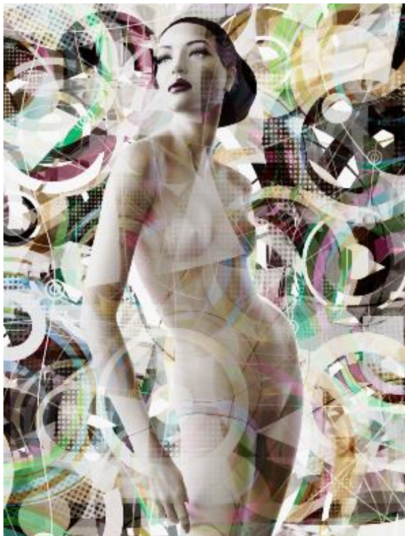
Valérie Belin, Electra (série Super Models) , 2015. Tirage pigmentaire, Courtesy de l'artiste et Galerie Nathalie Obadia, Paris/Bruxelles © ADAGP Paris 2023, Valérie Belin

Répondant à l'invitation du MusBA – qui convie régulièrement des artistes contemporains à porter un regard personnel sur ses collections – Valérie Belin propose Les visions silencieuses , une exposition monographique d'envergure organisée en partenariat avec la Galerie Nathalie Obadia (Paris, Bruxelles). Cette artiste est considérée comme l'une des plus importantes de sa génération et l'une des représentantes majeures de la photographie plasticienne.