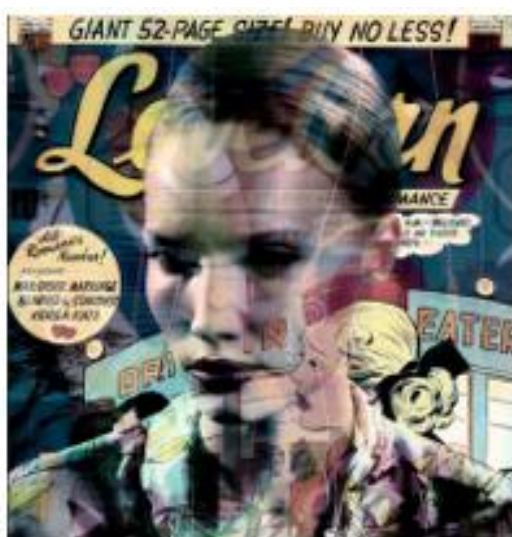
Valérie Belin, Confessions of The Lovelorn (All Star) , 2016, tirage pigmentaire, 173 x 130 cm (non encadré)

Comme l'artiste du Pop Art Roy Lichtenstein (1923-1997), Valérie Belin explore ici l'univers des comics , les BD américaines des années 50/60. Grâce à l'usage de filtres, les motifs des comics se superposent au visage du sujet. Ils forment un joyeux chaos qui sature l'espace du personnage, comme enfermé dans un monde clos.