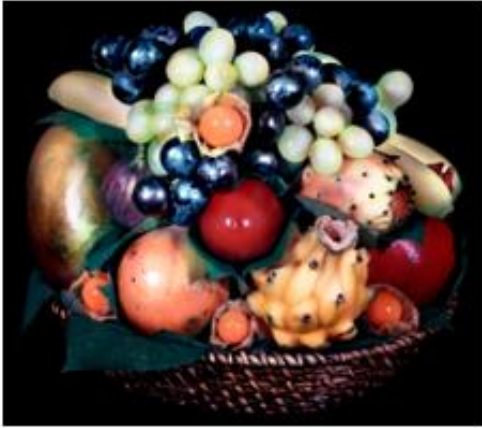
Valérie Belin, Sans titre (Corbeilles de fruits) , 2007, C-print, 180 x 205 cm (non encadré) © ADAGP Paris 2024, Valérie Belin, Courtesy de l'artiste et Galerie Nathalie Obadia, Paris/Bruxelles

Cette série a été conçue en correspondance avec des œuvres du peintre Edouard Manet (1832-1883) à l'occasion d'une exposition au musée d'Orsay en 2008-2009. Valérie Belin s'intéresse à l'art de Manet et à la "présence muette des choses" que l'on retrouve dans ses natures mortes. Comme lui, elle apprécie les motifs de la vie ordinaire tels qu'un panier de fruits, un citron ou une asperge.