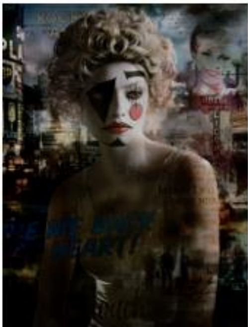
Valérie Belin, Lady Heart (Heroes) , 2022, tirage pigmentaire, 173 x 130 cm (non encadré) © ADAGP Paris 2024, Valérie Belin, Courtesy de l'artiste et Galerie Nathalie Obadia, Paris/Bruxelles

La série Heroes est composée de huit portraits de jeunes femmes maquillées dans un style qui s'inspire en partie des codes de la représentation théâtrale et du mime.