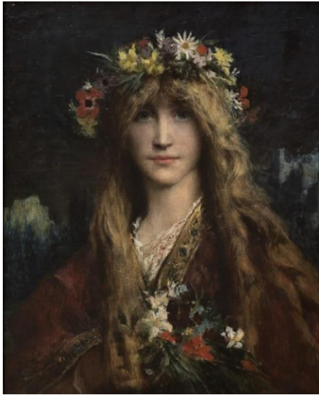
Jules-Élie Delaunay, Ophélie , 1882, huile sur bois