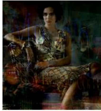
Valérie Belin, Portrait of June (Modern Royals) , 2020, tirage pigmentaire, © ADAGP Paris 2024, Valérie Belin, Courtesy de l'artiste et Galerie Nathalie Obadia, Paris/Bruxelles

Valérie Belin met en correspondance son Portrait of June avec celui d'une princesse hollandaise. Elle s'intéresse au portrait d'apparat et aux attributs liés à ce type de représentation (le luxe, les vêtements, le raffinement...). Elle trouve que les deux femmes ont des points communs. Elles prennent la pose, l'une est assise et l'autre s'appuie sur un fauteuil. Leurs regards s'adressent au spectateur. À la différence de la princesse, la « Modern Royal » ne porte pas de titre, c'est un personnage de fiction.