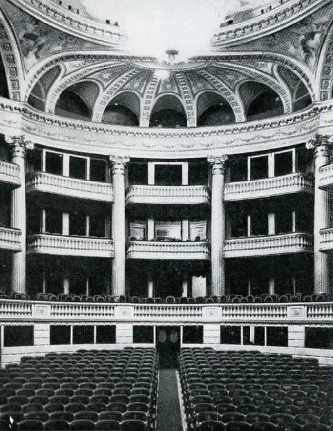
INTÉRIEUR DU GRAND-THÉÂTRE