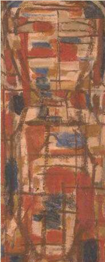
Roger Bissière Jeune femme au tricot huile sur toile