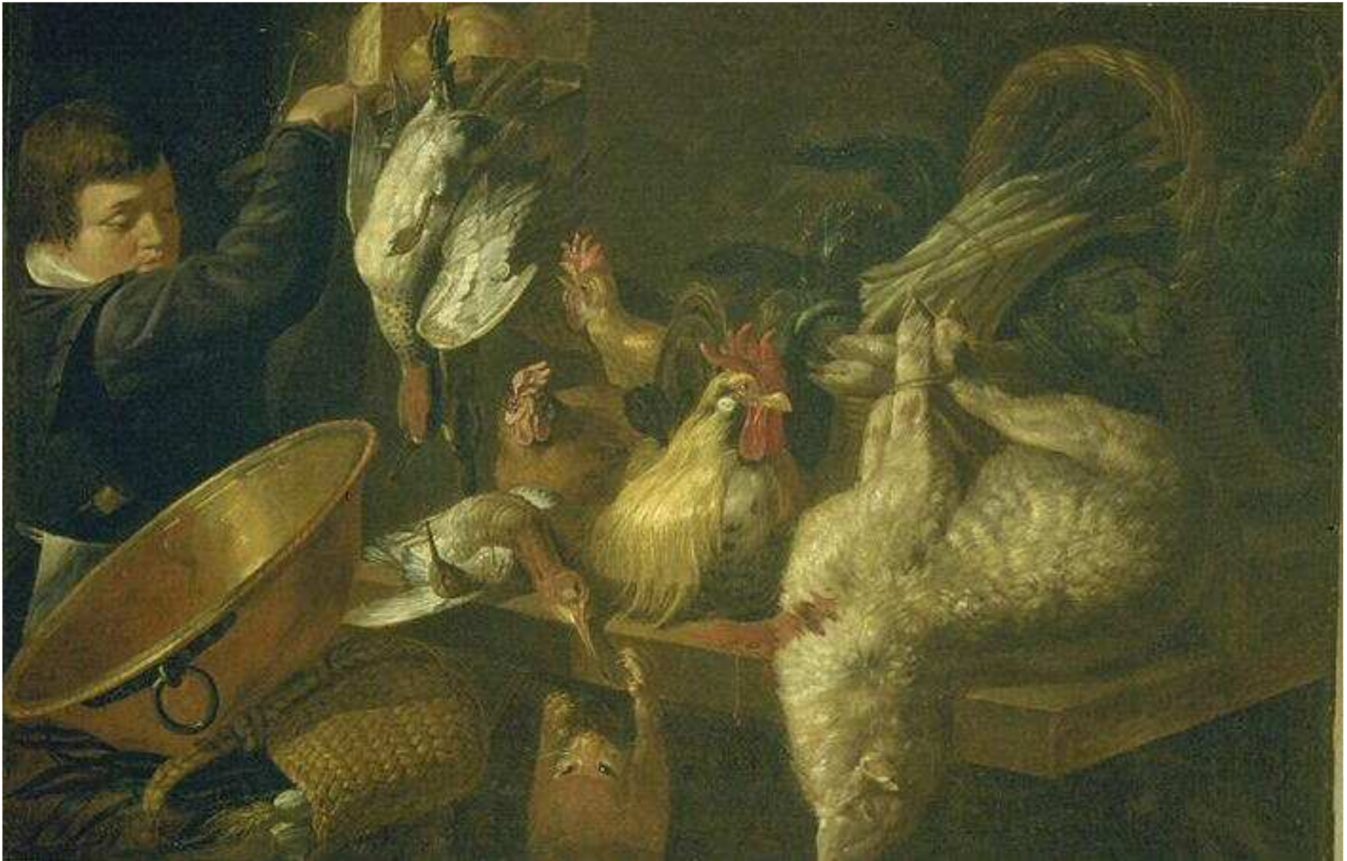
Giacomo Legi Jeune homme dans un garde manger , 1640 huile sur toile