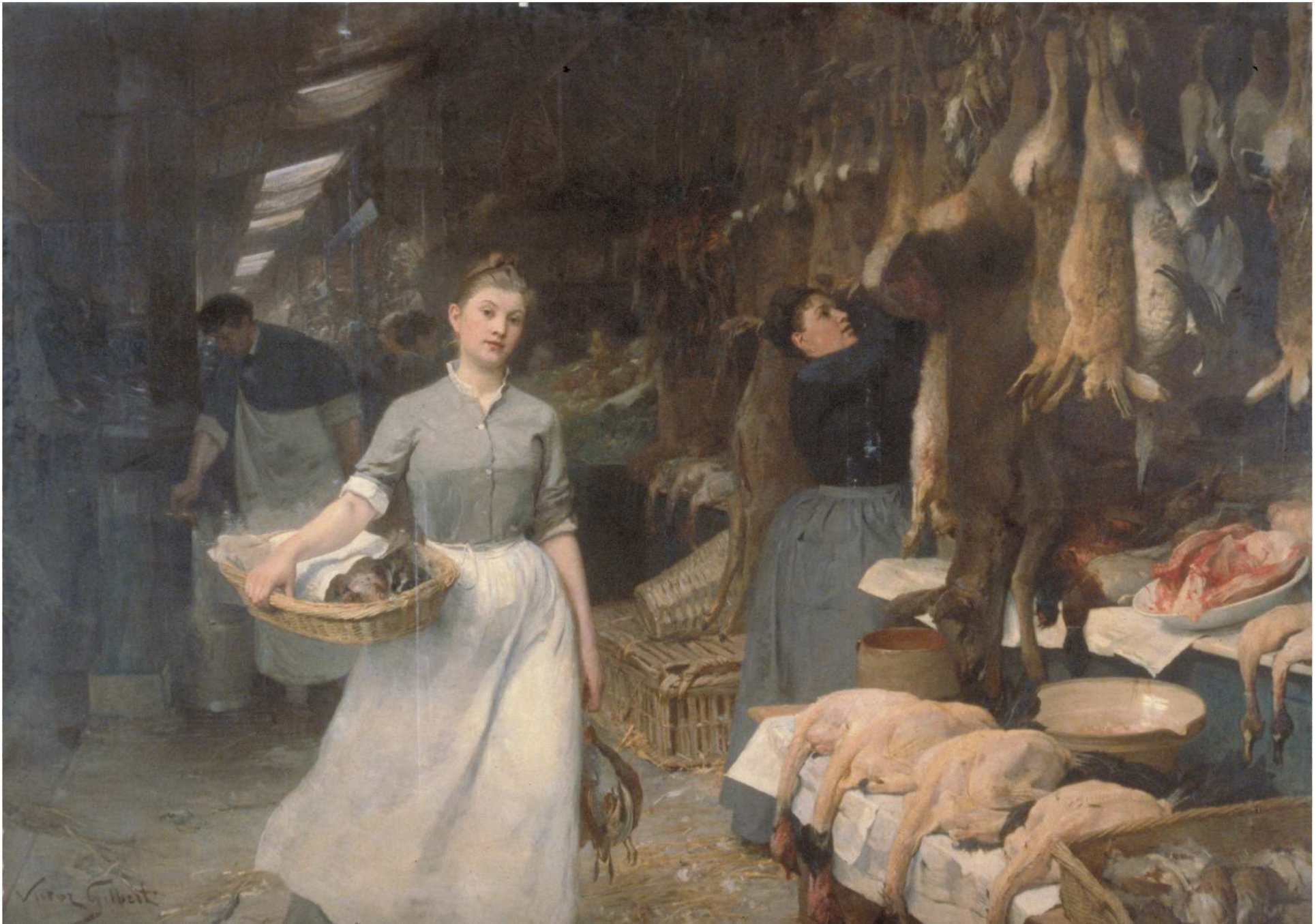
Victor Gilbert, un coin des halles Ecole française XIX e siècle huile sur toile,