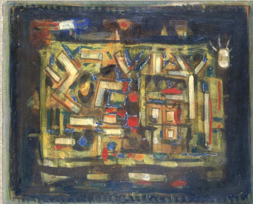
Roger Bissière Composition, 52 huile sur toile de coton rayée