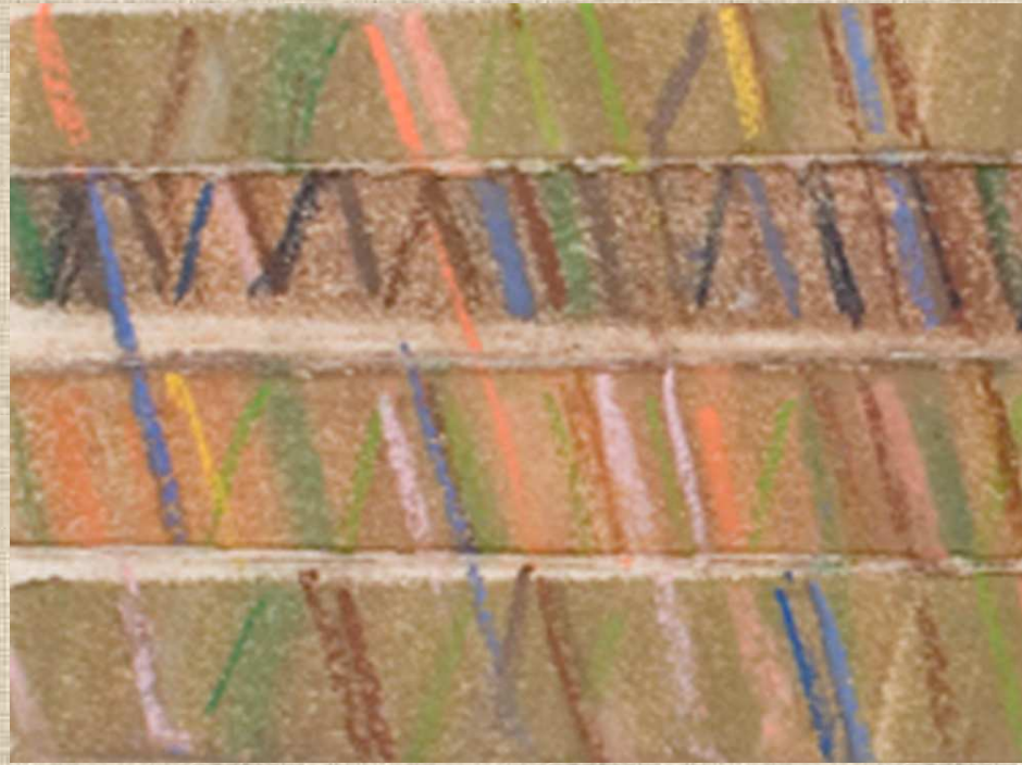
Voyage en France (détail)

Claude Lagoutte, Voyage en France lanières de toiles cousues, imprégnées de pigment et de médium