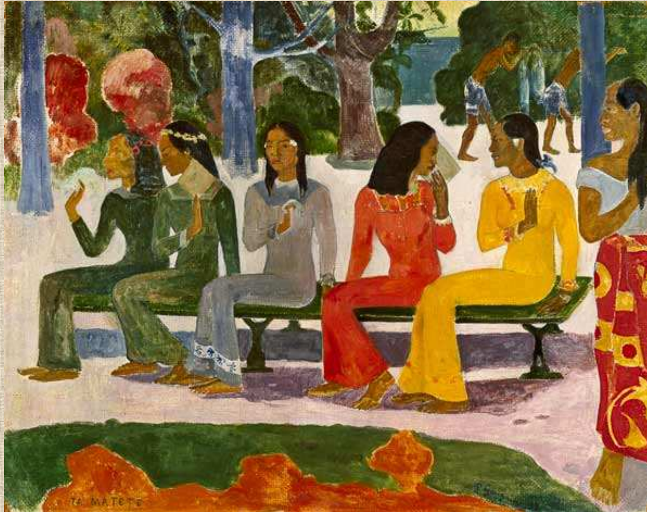
Paul Gauguin (1848 - 1903) Ta Matete , 1892, Huile sur toile