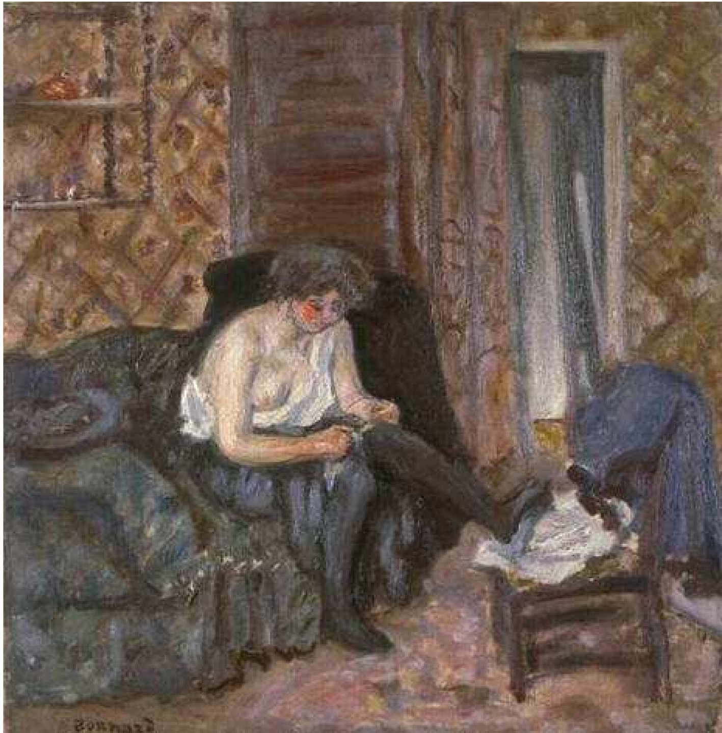
Pierre Bonnard, Les bas noirs , 1899, huile sur toile Dans Les bas noirs , Bonnard s'est plu à évoquer, avec la plus spirituelle négligence, le décor de l'intimité féminine.