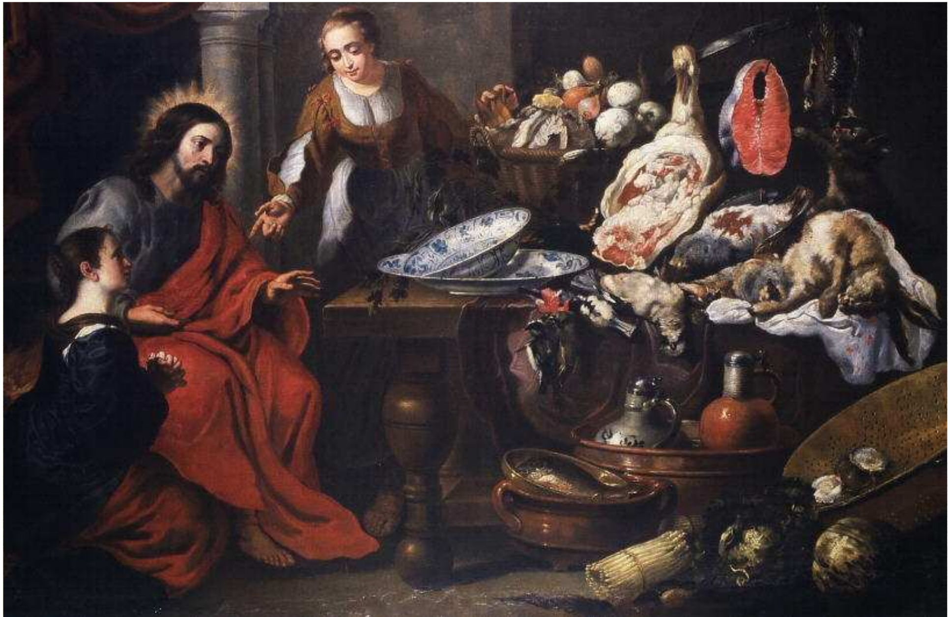
Erasme II Quellin, Jésus entre Marthe et Marie , Anvers, 1607- Anvers, 1678. huile sur toile