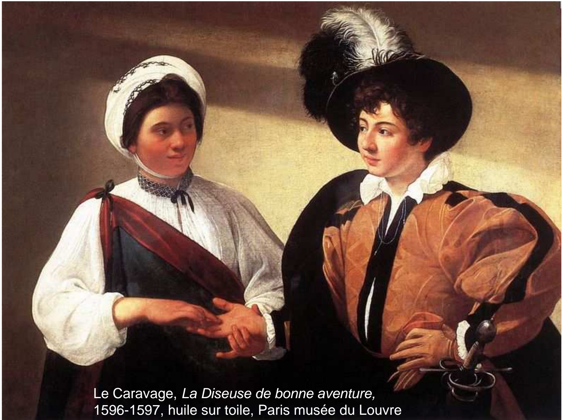
Le Caravage, La Diseuse de bonne aventure , 1596-1597, huile sur toile, Paris musée du Louvre